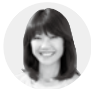
高橋 尚子 さん